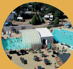
PISCINE AU CAMPING