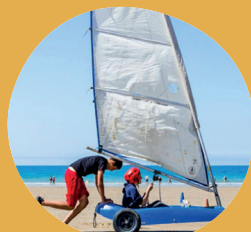
CHAR À VOILE