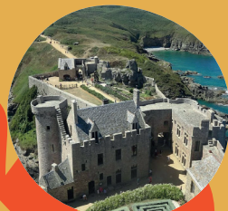
VISITE DU CHÂTEAU DE LA ROCHE GOYON